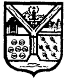
Gobierno Municipal de Hermosillo