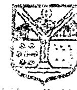
Gobierno Municipal de Hermosillo

Que el H. Ayuntamiento de Hermosillo, en sesión ordinaria de fecha 30 de octubre del 2002, acta número 59, se ha servido tomar el siguiente acuerdo: